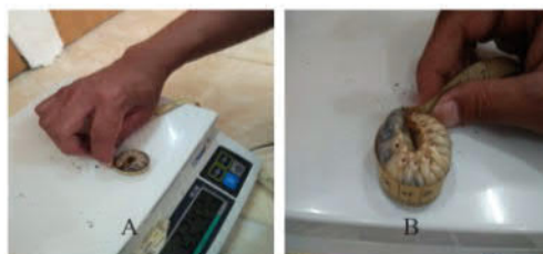
Gambar 2. Perubahan ukuran panjang larva Oryctes rhinoceros . A: panjang awal; B: panjang akhir.