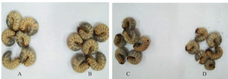
Gambar 1. Ukuran larva Oryctes rhinoceros setelah perlakuan pada berbagai media tumbuh. A: cacahan batang kelapa sawit; B: cacahan batang kelapa; C: cacahan batang sagu; dan D: cacahan batang pinang.

14 Nilai rata-rata ± SD, angka-angka pada lajur yang diikuti oleh huruf kecil yang tidak sama berbeda nyata taraf 5% (uji Duncan) setelah ditransformasikan ke dalam \sqrt{y} .