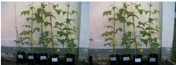
Gambar 1. Tanaman Kedelai Berumur 5 Minggu

Tinggi tanaman berkisar antara 96.42- 45.75 cm, kisaran angka ini ternyata jauh lebih tinggi dibanding deskripsi tanaman (Gambar 1). Hal ini disebabkan selama penelitian intensitas cahaya agak rendah karena di sekitar rumah kasa terdapat tanaman kelapa sawit. Kondisi lingkungan seperti ini menyebabkan tanaman mengalami etiolasi (memanjang) karena tajuk tanaman melakukan fototrofisme. Menurut Darmawan dan Baharsjah (1983), intensitas cahaya mempengaruhi pertumbuhan dan hasil kedelai. Penurunan intensitas cahaya menjadi 40 % sejak perkecambahan mengakibatkan penurunan jumlah buku, cabang, diameter batang, jumlah polong dan hasil biji. Intensitas cahaya sangat besar peranannya dalam proses fisiologi seperti fotosintesis, pernafasan, pertumbuhan dan perkembangan tanaman, pembukaan dan penutupan stomata. Penyinaran matahari mempengaruhi pertumbuhan, reproduksi dan hasil tanaman melalui proses fotosintesis. Oleh sebab itu, hubungan antara penyinaran matahari dengan hasil adalah kompleks.